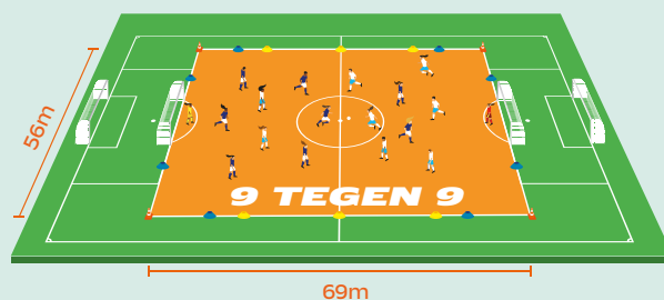
Speelveld 9v9 O13