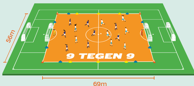
Speelveld 9v9 O13