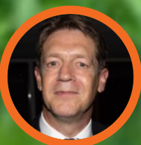
Just Spee (terugtreidend) Bondsvoorzitter